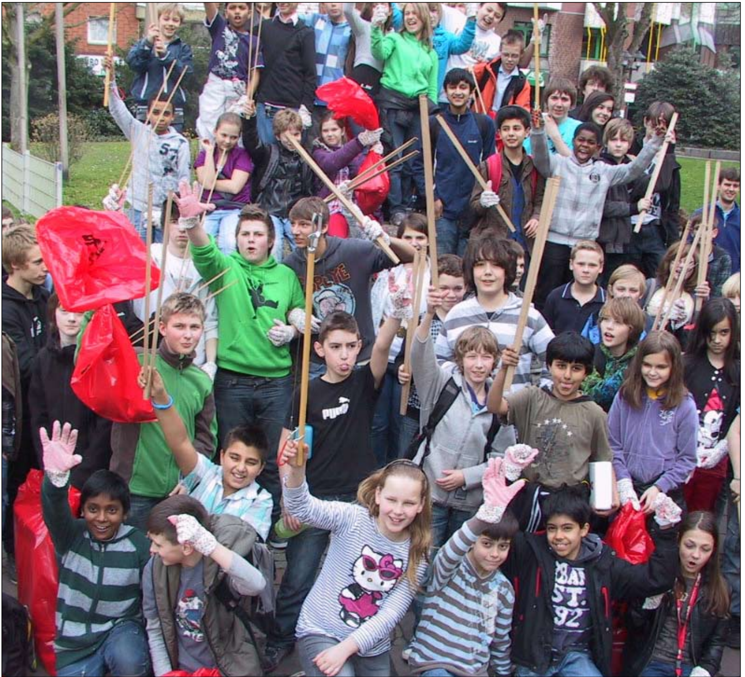
Auf geht's Gymbo – Schnapp dir den Müll!