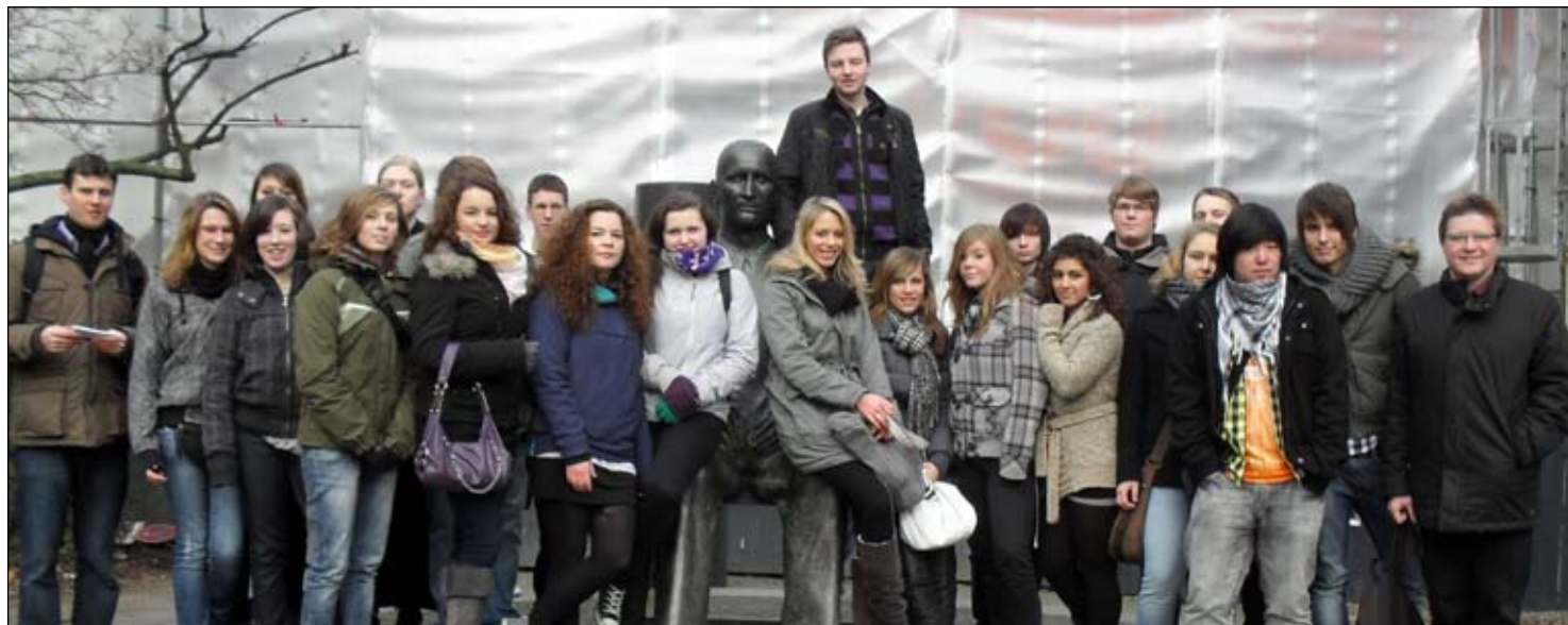
Brechts Denkmal vor dem „Berliner Ensemble“, umringt vom GK Deutsch 11