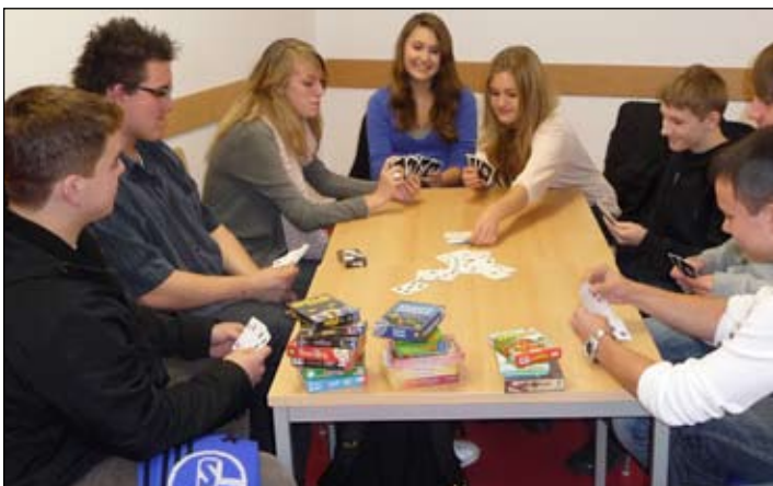
Wer Lust hat, kann seine freie Zeit auch mal mit Spielen in der neuen Cafeteria verbringen.